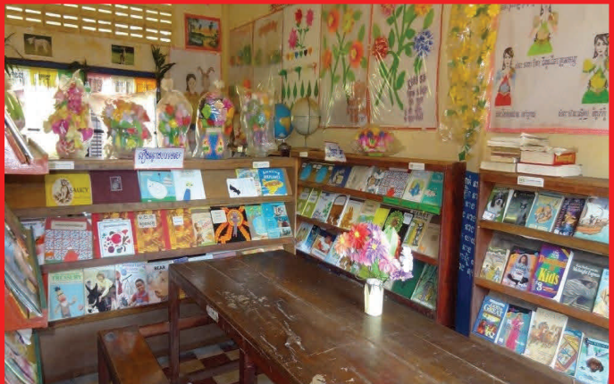
How to organize the library and display the students' works as well as keep cleaning of books