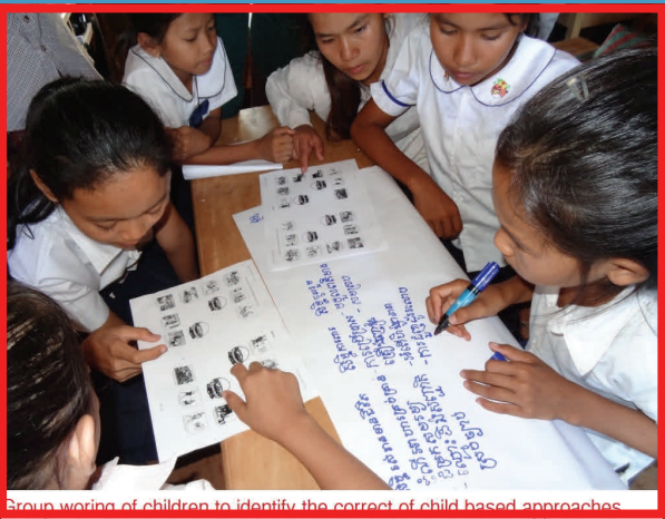
Group working of children to identify the correct of child based approaches

វគ្គបណ្តុះបណ្តាលនេះបានរៀបចំចាប់ពីថ្ងៃទី១៦ ដល់ ១៧ ខែ វិច្ឆិកាឆ្នាំ២០១២ ដោយបុគ្គលិកគម្រោង របស់អង្គការកាហ្វឌុក ក្រោមកិច្ចសហប្រតិបត្តិការពី មន្ទីរ និង ការិយាល័យអប់រំយុវជន និង កីឡា ដល់ គ្រប់សមាជិក ជាទីប្រឹក្សាជាស្ត្រី គណៈកម្មការទ្រទ្រង់សាលា និងទីប្រឹក្សាកុមារទាំងអស់ ក្នុង១០សាលាគោរដៅ។ វគ្គនេះ បានផ្តោតលើ ការទទួលខុសត្រូវ កាតព្វកិច្ច និង សិទ្ធិ កុមារ ។ រួមជាមួយគ្នានេះដែរ នៅក្នុងវគ្គនេះបានលើក យក វិធីសាស្ត្រ សិស្សមជ្ឈមណ្ឌល ល្បែងទំនាក់ទំនង